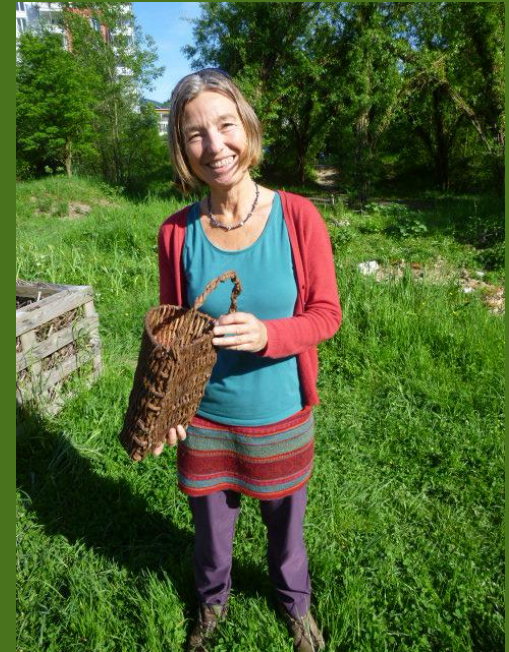
Wurmbox im Hochbeet