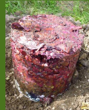
Bokashi wird 2 Wochen vererdet