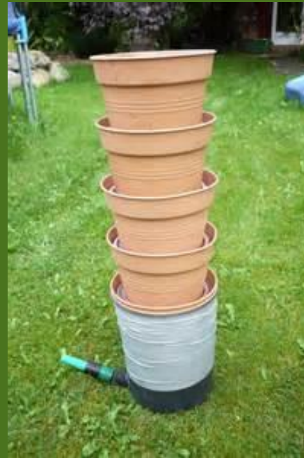
In Terracotta- Töpfen