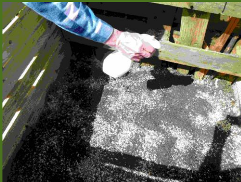
EMa auf Holzkohle und Gesteinsmehl