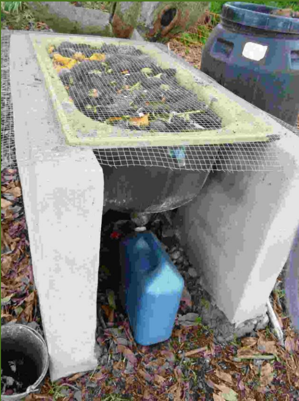
In alter Badewanne